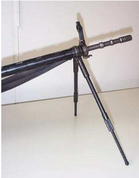
Bild 8: Verstellbare Zweibeinstütze zu Sturmgewehr 57 Modell Hämmerli AG