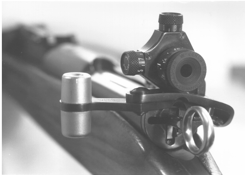
Bild 9: Linksriegel zu Karabiner 31 mit Diopteraufsatz Modell Bürgin

1 Linksriegel zu Karabiner 31, Modell Bürgin (Bewilligungen vom 30. August 1949 und 28. Februar 1980).